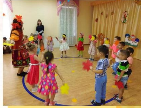
Мой первый учебный год и мой первый Осенний бал.

Я только начала свою профессиональную деятельность в должности музыкального руководителя. Многие знают меня, как воспитателя группы «Цыплята». И работать с детьми мне очень нравится. А еще я люблю петь, танцевать и устраивать праздники, даже специально этому училась и принимала участие в творческих конкурсах, таких как «Хрустальная капель». Я часто пела своим «цыпляткам» во время вечернего досуга и устраивала танцевальные игры на общих праздниках и развлечениях. Мои увлечения миром музыки не остались незамеченными: руководитель предложил сменить должность воспитателя на музыкального руководителя. Конечно, я с радостью согласилась. Ведь я получила возможность совместить два любимых дела — воспитывать любовь к музыке у детей не только личным примером.